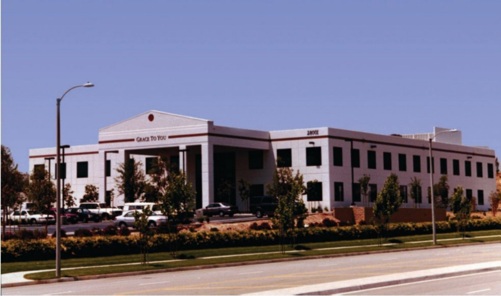
Oben: Das Grace to You -Gebäude von 2001 (Sun Valley bei Los Angeles, Kalifornien). Unten: Das Gelände der Grace Community Church und des The Master's Seminary .